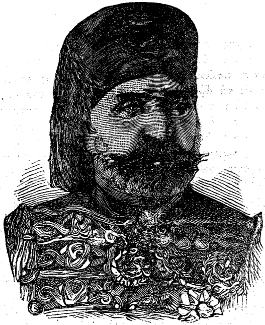
Ο ΒΕΗΣ ΤΗΣ ΤΥΝΙΔΟΣ

ὅτι τὴν 12 ἑκατονταετηρίδα μετὰ Χριστὸν εἶχεν εἰσαχθῆ ἢ χρῆσις αὐτῶν ἐν ταῖς οἰκίαις καὶ ἐθεωρεῖτο μάλιστα ὡς πολυτελείας ἐπιπλον ἐν Ἀγγλίᾳ. Ἡ ὑφανσις μαλλίων ταπήσων, μετενεχθεῖσα ἐκ Περσίας, εἰσήχθη ἐν Γαλλίᾳ ἐπὶ τῆς βασιλείας Ἑρρίκου τοῦ Δ', τῷ 1610, ὅτε εἶχον μεγάλην τιμὴν οἱ περσικοὶ καὶ τουρκικοὶ τάπητες. Ὁ ἐργαλεῖος ἢ ἄλλως καλουμένη Ὀλλανδικὴ ὑφαντικὴ μηχανὴ εἰσήχθη ἐν Λονδίῳ ἐξ Ὀλλανδίας τῷ 1678 περίπου, ἀλλ' ἐκτοτε ἐτροποποιήθη μεγάλως, ἐβελτιώθη καὶ τοιαύτην ἔλαβε κυκλοφορίαν καὶ ἀνάπτυξιν ἢ τοῦ τοιούτου εἶδους μηχανή, ὥστε ἐν τῇ μεγάλῃ Βρεττανίᾳ ὑπάρχουσιν ἤδη 250,000 ὑφαντικαὶ μηχαναὶ διὰ τῶν χειρῶν κινούμεναι καὶ 75,000 μηχαναὶ τοιαῦται, αἵτινες κινούνται διὰ τοῦ ἀτμοῦ, ἐκάστη τῶν ὁποίων ὑφαίνει 22 πήγεις καθ' ἐκάστην. Αἱ διὰ τοῦ ἀτμοῦ ὅμως αὐταὶ μηχαναὶ εἰσήχθησαν τῷ 1807.